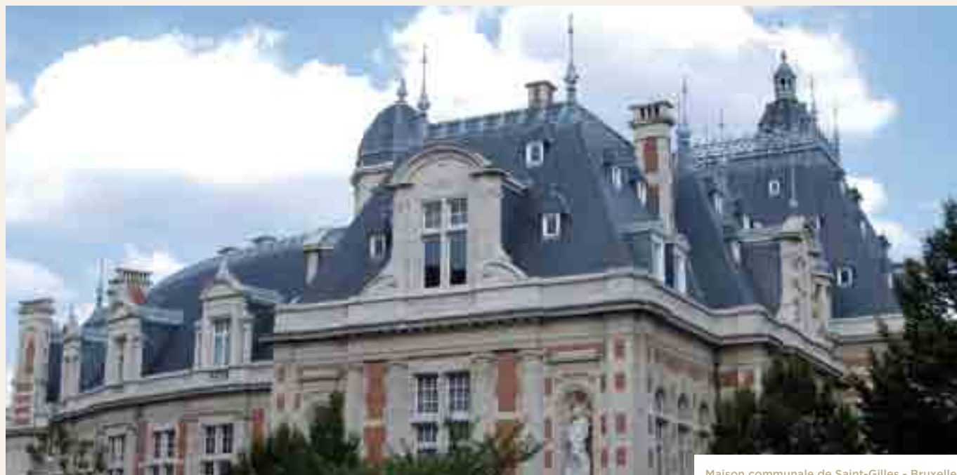
Maison communale de Saint-Gilles - Bruxelles