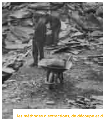
les méthodes d'extractions, de découpe et de transport ont considérablement évolué. Pour autant, un maître fendeur continue à un rythme d'environ 4.000 ardoises/jour depuis plusieurs générations.

Même pour les très grands formats, il existe une règle pour l'exfoliation, ou la fente, de l'ardoise. Les blocs de schiste peuvent être fendus à partir d'un mètre d'épaisseur. Pour cette dimension, le mieux, et le plus sûr, c'est de diviser ce bloc en deux parties égales, puis de répéter l'opération jusqu'à obtenir des pièces de 25 cm. Passée cette dimension, il convient de prendre plus de précautions pour subdiviser les plaques finales sans qu'elles ne se cassent ou se fissurent. Bien que le procédé d'exfoliation ait peu évolué, ce qui a progressé, c'est l'optimisation des blocs afin de produire des ardoises plus fines.