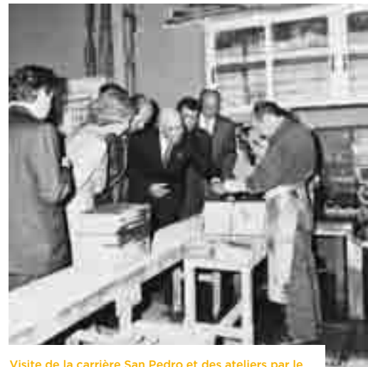
Visite de la carrière San Pedro et des ateliers par le Roi Juan Carlos.

Mon souvenir le plus marquant est la visite que Ses Majestés le Roi et la Reine d'Espagne firent au Bierzo. Ils choisirent l'exploitation de San Pedro de Trones en tant que référent de l'industrie ardoisière. Grâce à cela, j'ai eu l'opportunité d'être le serviteur de Don Juan Carlos I, et de lui expliquer tout ce qui concernait notre métier.