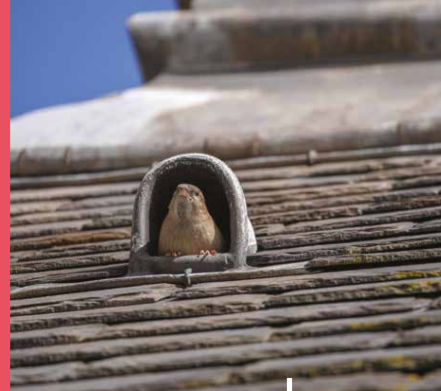
Moineau dans un passe corde, Hôtel de Sully.