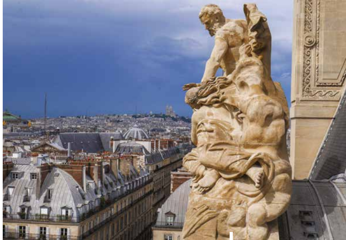
Depuis le fronton des Arts décoratifs, côté Tuileries.

Dans le patrimoine, la variété des édifices mais aussi des matériaux de couverture me permet de réinventer mon métier tous les jours. Il y a une grande part d'observation et de lecture de l'existant : des challenges quotidiens de compréhension et de réalisation.