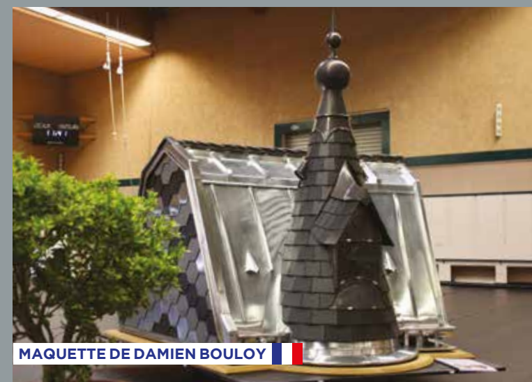
MAQUETTE DE DAMIEN BOULOY