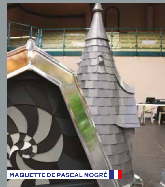
MAQUETTE DE PASCAL NOGRÉ