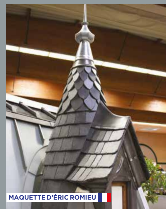
MAQUETTE D'ÉRIC ROMIEU