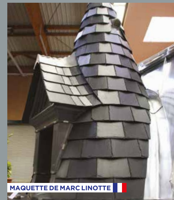
MAQUETTE DE MARC LINOTTE