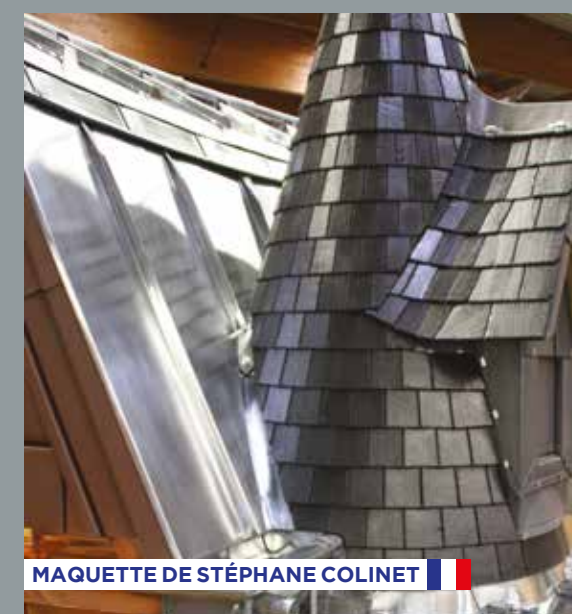
MAQUETTE DE STÉPHANE COLINET

Couverture : Balas - Ardoise : Excellence 10 Lettre d'information éditée par CUPA PIZARRAS SA Directeur de la publication : Eduardo Mera - Conception : Erwan Galard Maquette : l'Épicerie Graphique - Impression : Imprimerie IPO